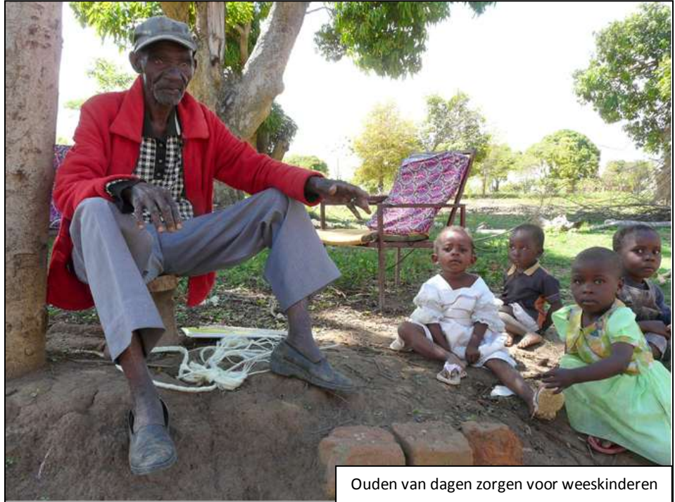
Ouden van dagen zorgen voor weeskinderen