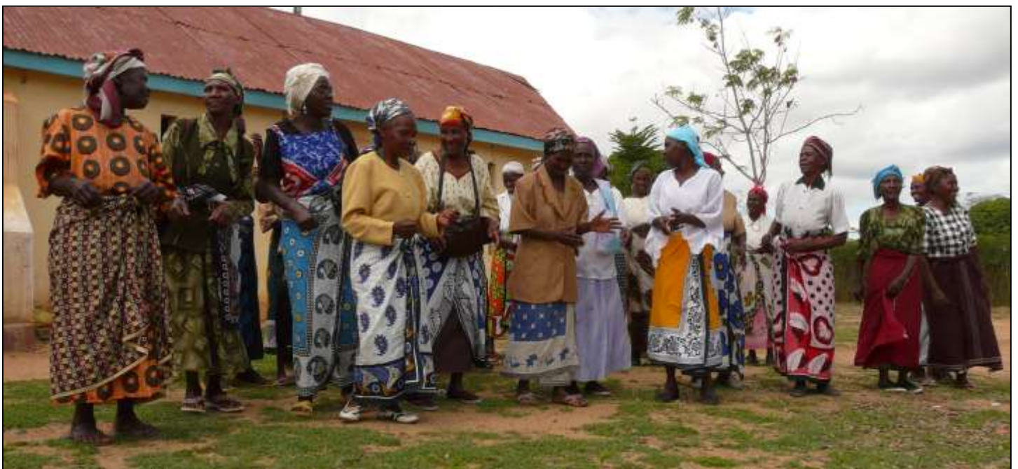
Vrouwengroep in Kitui, 3 uur rijden van de hoofdstad van Kenia: Nairobi

genereren. We hebben samengewerkt met bedrijven, organisaties en mensen met een grote maatschappelijke betrokkenheid en zijn daar heel dankbaar voor. We stonden op markten en vertelden verhalen op scholen en gaven workshops. Ook was er weer iemand die zijn verjaardag vierde, een bedrijfsmatige viering en geen cadeau wilde maar een donatie voor Harambee. En iemand die het hele jaar een spaarpot had klaarstaan voor Harambee. Wij willen graag iedereen met naam en toenaam bedanken maar tegelijkertijd realiseren we ons dat we wellicht iemand niet genoemd hebben die er zeker wel had moeten staan: vergeef het ons maar weet dat onze dank groot is!