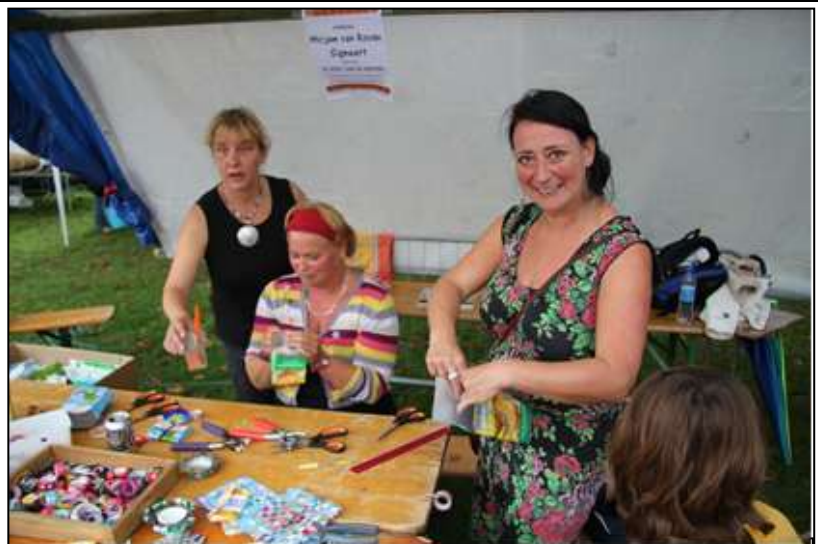
Recycle Workshop tijdens een festival

Dankzij de inzet van vele vrijwilligers is het mogelijk geweest om met onze stand op verschillende markten en evenementen een kleine 2000 euro bij elkaar te verdienen. (vorig jaar was dat nog 1000 euro) Dat tikt lekker aan. En dan heeft de maakster van de sieraden ook nog een verdienste! Wat nieuw is tijdens onze marktbezoeken, zijn de recycle-workshops. Op de valreep hebben we afgelopen december deelgenomen met onze stand aan een event in Beek : Met Passie, een aantal mensen met een passie stelden daar hun producten te koop en ten toon. De passie van Harambee is duidelijk: geld inzamelen voor het goede doel. We hebben sieraden en recycle-portemonnees verkocht. Na dit weekend hebben de beide