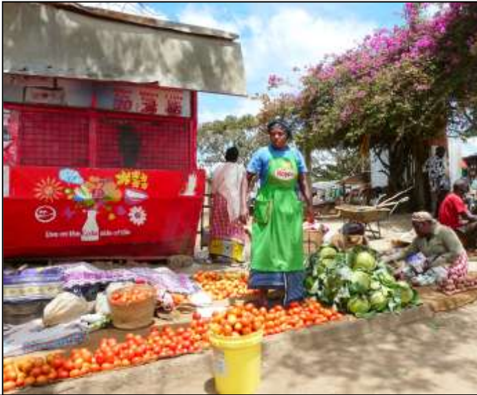
Markt in Nairobi

Wederom danken wij iedereen die Harambee een warm hart toedraagt en een bijdrage levert aan het doel van Harambee: geld inzamelen om jongeren in Kenia naar school te laten gaan. Sommigen doen dat door financiële steun, anderen met persoonlijke inzet en weer anderen in 'natura': het leveren van goederen en diensten om uiteindelijk geld te