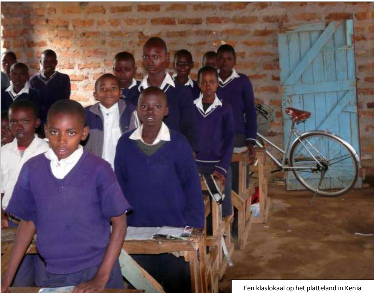
Een klaslokaal op het platteland in Kenia

Ik heb inmiddels mijn derde baan, ik werk voor Kenya Data Network. Dit bedrijf bouwt aan een glasfiber infrastructuur in Kenya. Ik hou me bezig met de inkoop en het magazijnbeheer. Hoewel mijn baan niet echt goed betaald wordt kan ik het schoolgeld van mijn vrouw betalen én onze basisbehoeften. Mijn vrouw volgt een IT-opleiding die ze over twee jaar zal afronden. We hebben een dochter van bijna twee. Als mijn vrouw haar opleiding heeft afgerond en een baan heeft zal ons gezin het beter krijgen en kan onze dochter naar school gaan. We wonen niet ver van het Jomo Kenya International Vliegveld in Nairobi en niet ver van mijn kantoor. Toch ga ik elke dag met de bus op en neer van en naar m'n werk door heel erg druk verkeer met veel files.