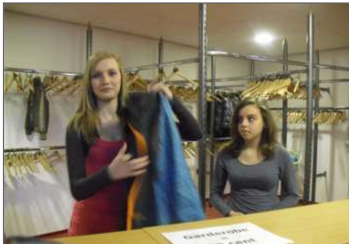
Stagiaires aan de slag tijdens Dance for Harambee in de garderobe

“Wij lopen stage bij Stichting Harambee. We